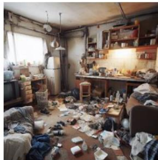
Kuva 2. Esimerkki sotkuisesta huoneesta. Huoneessa on tavaraa tasoilla ja lattialla, mutta huoneessa pystyy liikkumaan.

Ovenleveys on käyttökelpoinen mitta poistumisreitien leveydelle.