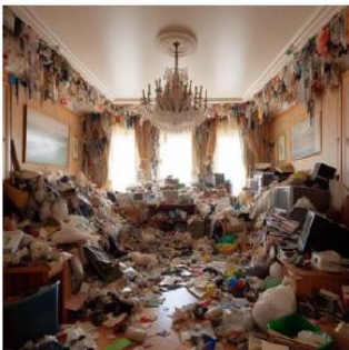
Kuva 1. Esimerkki huoneesta, jossa on suuri tavaramäärä.