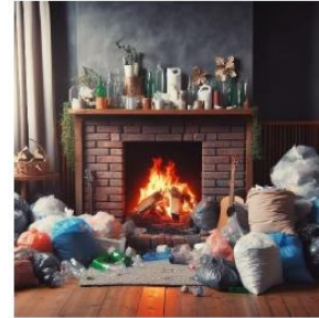
Kuva 4. Esimerkki tulisijasta, jonka läheisyydessä on palavaa materiaalia.

Myöskään parvekkeella ei saa polttaa kynttilöitä tai lyhtyjä valvomatta eikä palavan materiaalin päällä tai läheisyydessä.