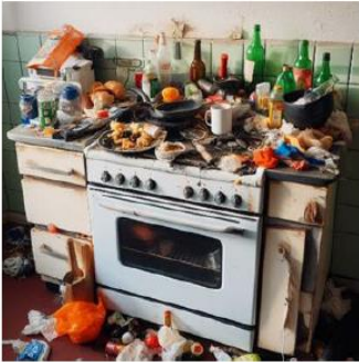
Kuva 3. Esimerkki liedestä, jonka päälle jäänyt tavara aiheuttaa palonvaaran.

Mikäli asukkaalla on toistuvia läheltä piti -tilanteita liedessä (levyt unohtuvat päälle, ruuan valmistus unohtuu ja asukas menee esim. lepäämään), lieteen voi asentaa liesivahdin tai ajastimen. Joissain tapauksissa liedessä käytön voi myös estää irrottamalla sähkölieden sulakkeen tai ääritapauksessa sähköasentaja voi irrottaa sähkölieden virransyötön.