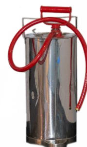
Kuva 6: Sankoruisku