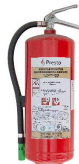
Kuva 4: Nestesammutin

Sammutuspeite sopii pienten palonalkujen ja ihmisten päällä olevien vaatteiden sammuttamiseen tukahduttamalla. Suositeltava koko on vähintään 180 x 120 cm.