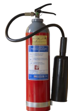
Kuva 5: Hiilidioksidisammutin