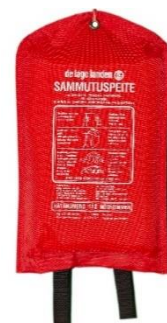
Kuva 7: Sammutuspeite