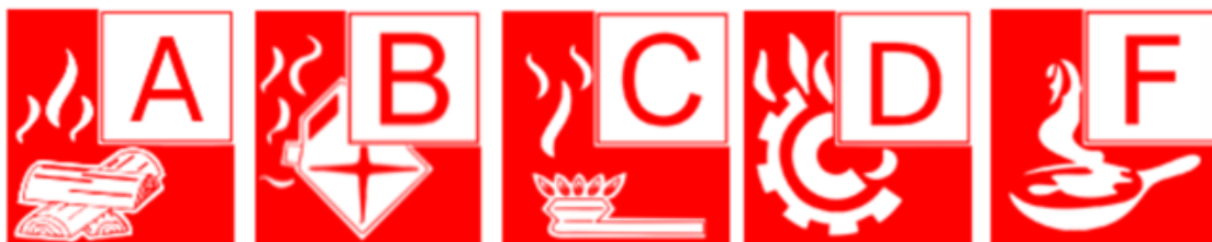
Kuva 1: Käsisammuttimien teholuokat kertovat, minkä tyyppisiä paloja sammuttimella voi sammuttaa.