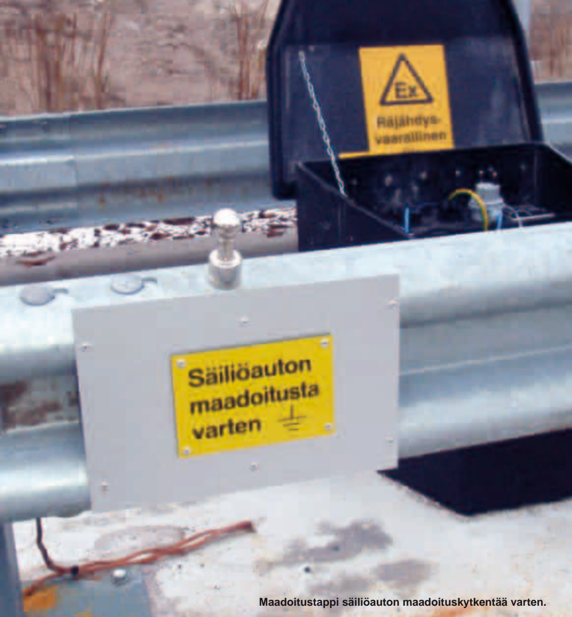
Maadoitustappi säiliöauton maadoituskytkentää varten.