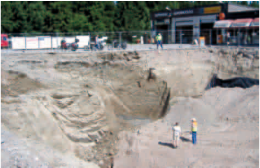
Kuvassa polttonesteiden jakeluaseman pilaantuneen maan kunnostustyömaa.