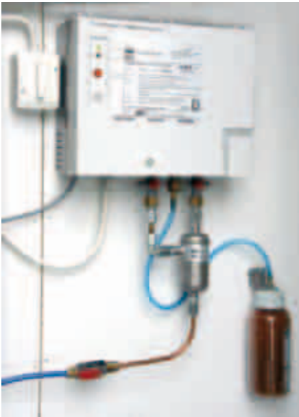
Vasemmassa kuvassa kaksoisvaippaisten imu- ja täyttöputkien paineilmatoinen välitilanvalvontajärjestelmän hälytyn.