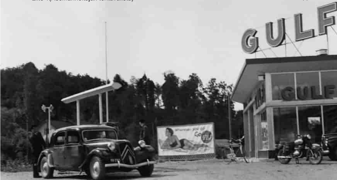
Polttonesteiden jakelua vuonna 1957.