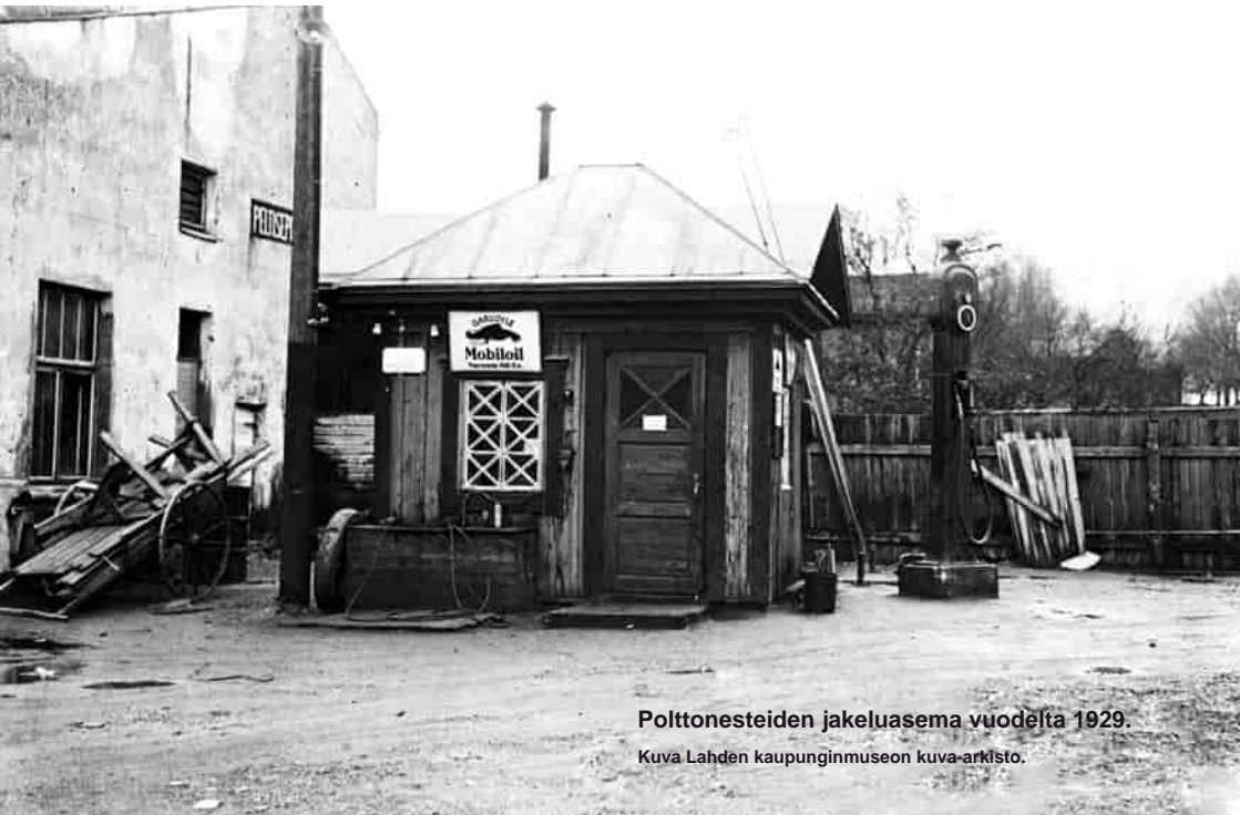
Polttonesteiden jakeluasema vuodelta 1929.

Ympäristönsuojeluviranomaisen määräaikais-tarkastusta ennen tarkistetaan polttonesteiden jakeluasemaa koskevien tietojen ajantasaisuus, kuten lupamääräysten toteuma, viimeisimmän vuosiyhteenveton sisältö, säiliöiden määräaikaistarkastustodistukset, pohjavesi- ja huokosilmatarkkailutulokset, mahdollisten valitusten sisältö sekä edellisen tarkastuksen kehotusten toteuma. Ympäristönsuojelutarkastajille on laadittu muistilista, jota voi käyttää tarkastustyössä apuna. Muistilistan voi ladata netistä osoitteesta: http://www.pelastuslaitokset.fi/Kumppanuusverkosto-352