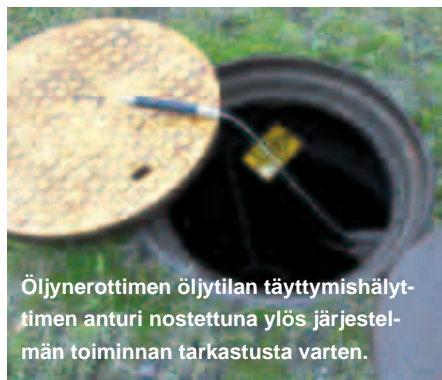
Öljynerottimen öljytilan täyttymishälyttimen anturi nostettuna ylös järjestelmän toiminnan tarkastusta varten.

Standardissa SFS 3352 mainitun biopolttoaineseos C:n jakeluun käytettävän jakelulaitteen huollossa ja valvonnassa on noudatettava tihennettyä tarkastusväliä. Biopolttoaineseos C voi aiheuttaa leväkasvua suodattimiin ja siitä johtuvia suodattintukoksia. Suositeltava suodattimien vaihtoväli on 1 vuosi. Jakelulaitteen tiivisteiden, kumiletkujen ja muiden kumiosien tarkastusväliä on lyhennettävä valmistajan ohjeiden mukaisesti.