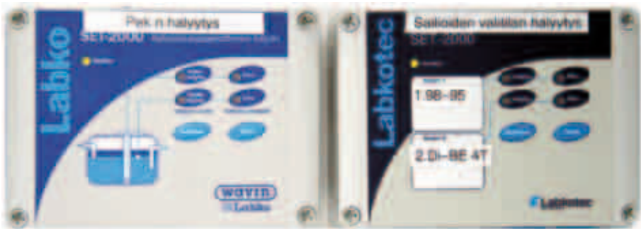
Öljynerotimen (PEK) ja säiliöiden vuodonilmaisujärjestelmän (kaksoisvaippasäiliön välitila) hälyttimet.