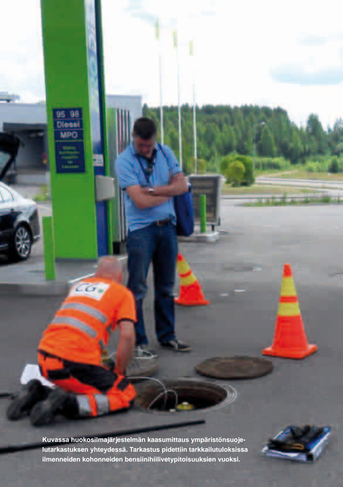
Kuvassa huokosilmäjärjestelmän kaasumittaus ympäristönsuojelutarkastuksen yhteydessä. Tarkastus pidettiin tarkkailutuloksissa ilmenneiden kohonneiden bensiinihiilivetytitoisuuksien vuoksi.