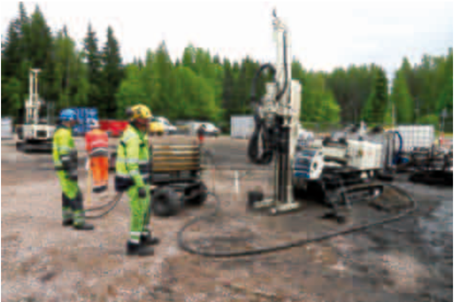
Kuvassa Insitu-kunnustus polttonesteiden jakeluasematontilla (maanpinta on värjäytynyt maaperään ruiskutettavasta aktiivihillestä).