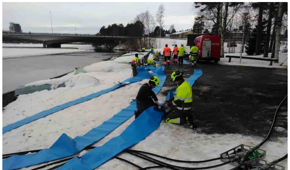
Kuva: Mika Haverinen Oulu-Koillismaan pelastuslaitos. Kuvassa harjoitellaan tulvaletkulinjan rakentamista

tetty muutaman vuorokauden kestänyt oma kenttäharjoitus, johon liittyi myös TAST:n järjestämä leiriolosuhde. EU tekee tulevan elokuun aikana konsultoivan vierailun ja tarkastuskäynnin HCP-muodostelman sertifiointiin liittyen. Seuraavan puolentoista vuoden aikana joukon johtoa osallistuu karttajarjoitukseen ja HCP-moduuli osallistuu syyskuussa 2023 Puolassa olevaan HCP-muodostelmen kenttäharjoitukseen. Tämän jälkeen alkaa muodostelman viiden vuoden sitoumusaika EU:n pelastuspalvelumekanismin poolissa.