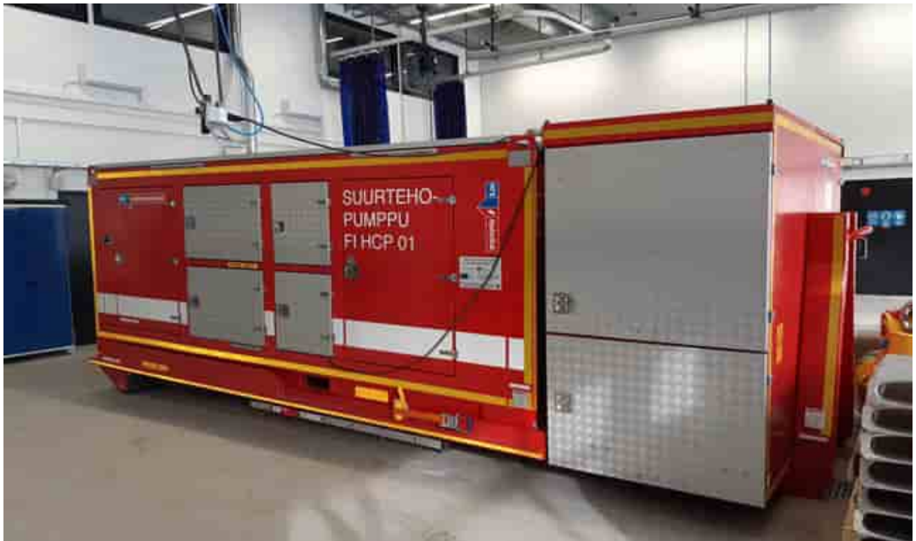
Kuvassa suuretehopumppu HS 250 kuljetusalustalla

osoittamalla avunpyyntö Oulu-Koillismaan pelastuslaitoksen päivystävälle päällikölle.