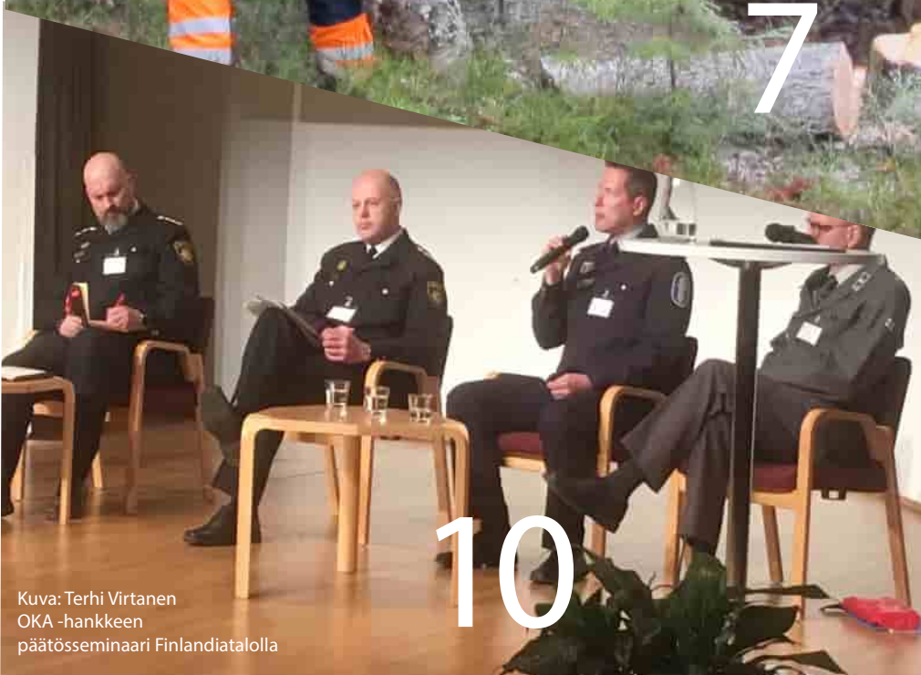
OKA -hankkeen päättöseminaari Finlandiatolalla